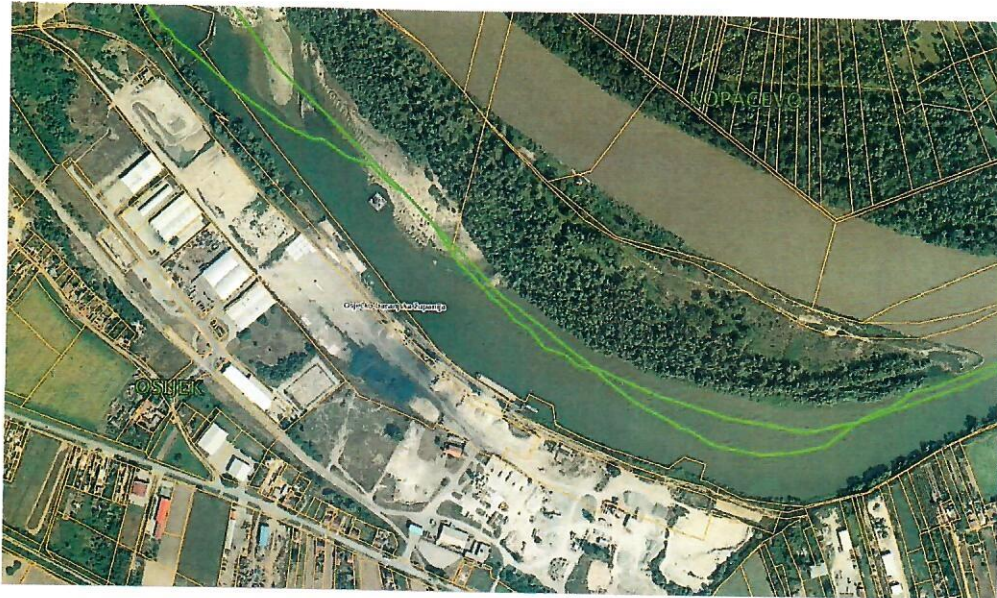
Slika.1: Pregledna situacija luke Osijek