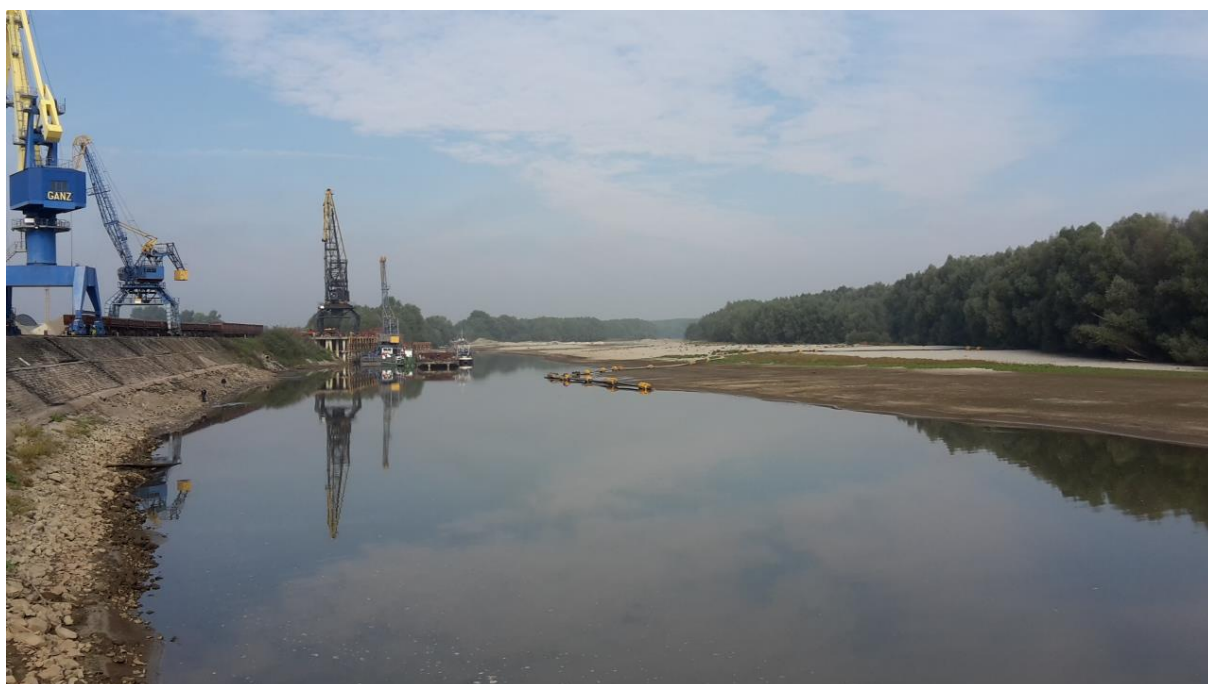
Slika.2: Akvatorij u luci Osijeku